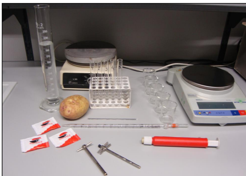
Ilustração 2: Material