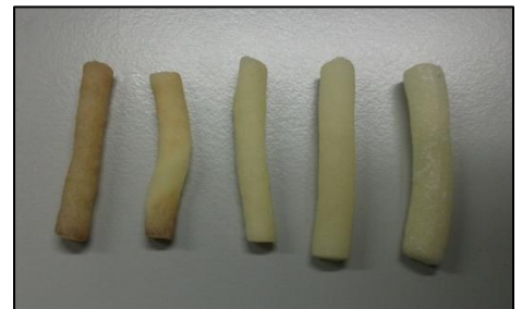
Ilustração 5: Aspeto dos cilindros de batata antes da pesagem final