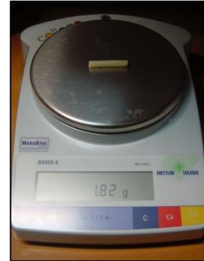
Ilustração 3: Pesagem do cilindro de batata